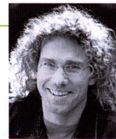
HP Tobias Hauser Grünhülstr. 25 86911 Dießen am Ammersee

Deutsches Zentrum für BowenTherapie Johann-Michael-Fischer-Str. 2 D-86911 Dießen am Ammersee Tel.: 08807/94 77 35 Fax: 08807/94 69 95 E-Mail: dzbt@BowenTherapie.de